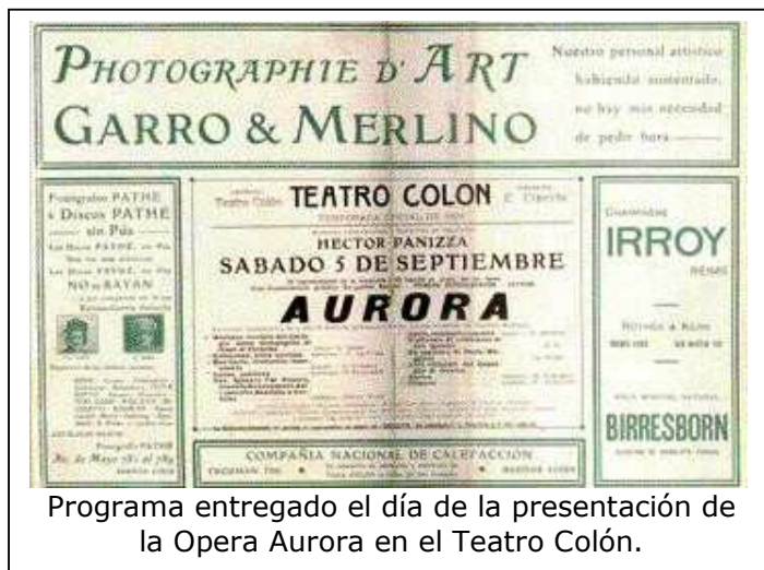
Programa entregado el día de la presentación de la Opera Aurora en el Teatro Colón.

general Edelmiro J. Farrell y el coronel Juan Domingo Perón. Tal y como sucedió en el estreno de la versión italiana, el público ovacionó el aria dedicada al pabellón nacional. Ese mismo año que, por decreto del poder ejecutivo, fue incluida dentro del conjunto de canciones patrias y así llegó a la escuela. A partir de ese momento "La canción a la Bandera", o simplemente, "Aurora" es entonada en actos