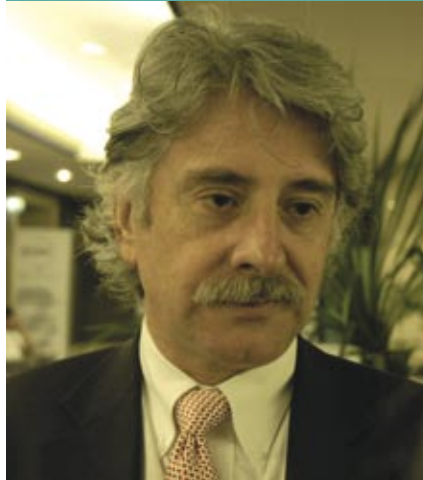
Entrevista a LEONARDO GARNIER, Ministro de Educación de Costa Rica.

“Las utopías son buenas mientras se camine hacia ellas”