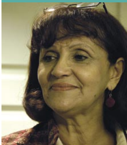
Entrevista a VLADIMIRA MORENO , Viceministra de Asuntos Educativos del Ministerio del Poder Popular para la Educación de Venezuela.

“Toda revolución al final es una revolución cultural”