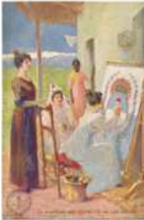
Damas mendocinas bordando la Bandera de los Andes

La lectura de estos textos enriquecerá la información disponible, así como también generará nuevas preguntas, por ejemplo, ¿cómo habrán hecho para transportar todos esos elementos por la montaña en pasos tan estrechos? De este modo puede quedar en evidencia la idea de construcción provisoria de conocimiento: la búsqueda de nueva información enriquece lo que ya se sabe, a la vez que abre nuevos interrogantes que impulsan nuevas indagaciones.