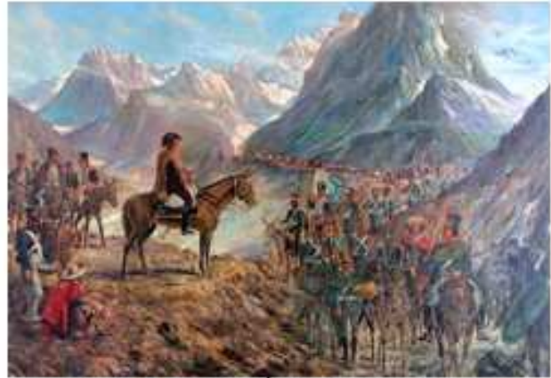
Cruce de los Andes. Óleo de Franz Van Riel.

La escena muestra los angostos desfiladeros, a la vez que permite dimensionar de manera aproximada la altura de las montañas. En algunos pasajes, fue necesario encolumnarse de a uno debido al escaso espacio disponible.