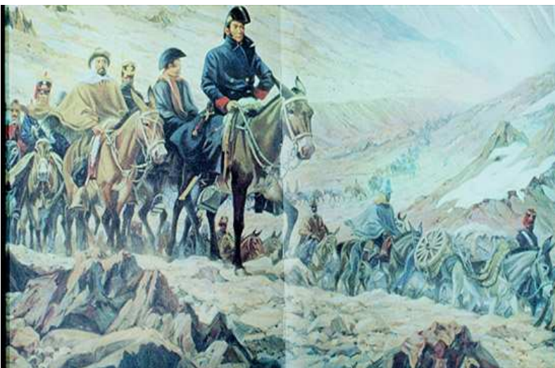
Óleo de Pedro Maggi. Pinacoteca del Instituto Nacional Sanmartiniano.

Deberán seleccionarse cuidadosamente algunas escenas en las que sea posible ver que no todos los soldados tenían el mismo uniforme, que había "gauchos" y negros; se podrá mostrar la presencia de baqueanos, arrieros, etc. Para ello, será necesario prever consignas y preguntas, en tanto las representaciones de los chicos sobre los soldados, suelen ser bien distintas a lo que muestran algunas imágenes; y disponer el espacio de modo que todos puedan observar detenidamente. El trabajo en pequeños grupos, la posibilidad de mirar de cerca las imágenes, la orientación a través de preguntas o aspectos a focalizar, constituyen intervenciones didácticas que atienden al propósito de esta actividad, ofreciendo a los niños oportunidad de buscar información.