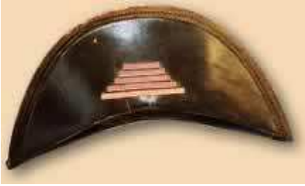
Falucho de San Martín

¿De qué material parece estar hecho? ¿Por qué? Este famoso sombrero (llamado falucho) era de un material charolado, lo cual lo hacía impermeable.