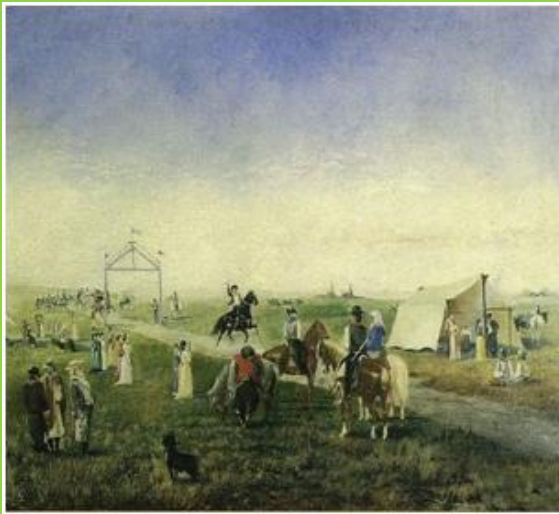
“El Pato” de Florencio Molina Campos

Se podrá indagar: ¿Qué juegos perduran hasta la actualidad? ¿Se continúan jugando del mismo modo? ¿Quiénes participaban en la época colonial?