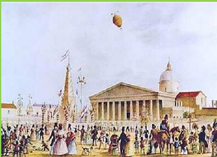
"Fiestas Mayas" de Pellegrini

El docente circulará por los grupos tomando notas de lo que los niños dicen para posteriormente intervenir.