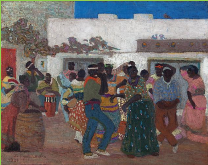
"Candombe" de Pedro Figari