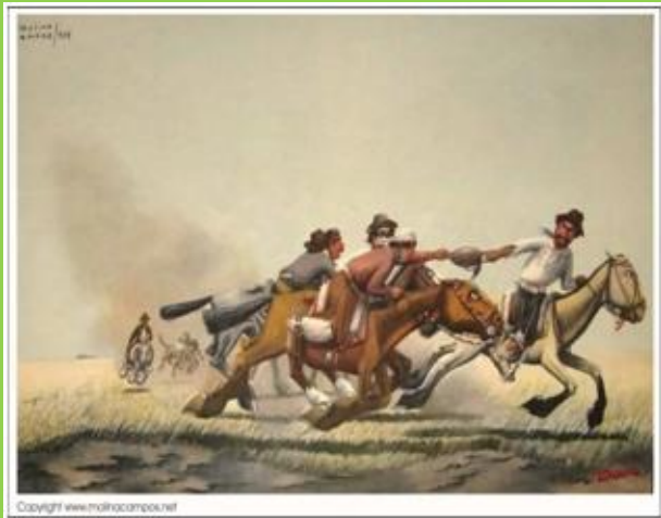
“Carrera de sortijas” de Florencio Molina Campos