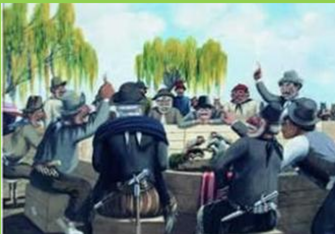
“Riña de Gallos” de Florencio Molina Campos