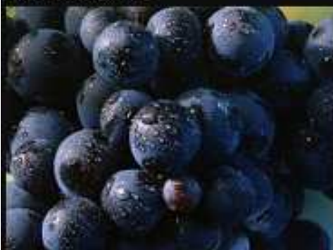
Con nuestro Malbec