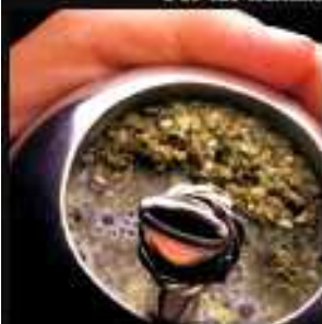
Por las mañanas usos mates